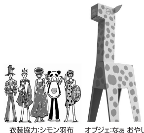
衣装協力:シモン羽布 オブジェ:なあ おやじ

リンゴ柄の「キリン」が登場! 花びら型のメッセージカードを貼って、みんなで「花の動物」を完成させよう。